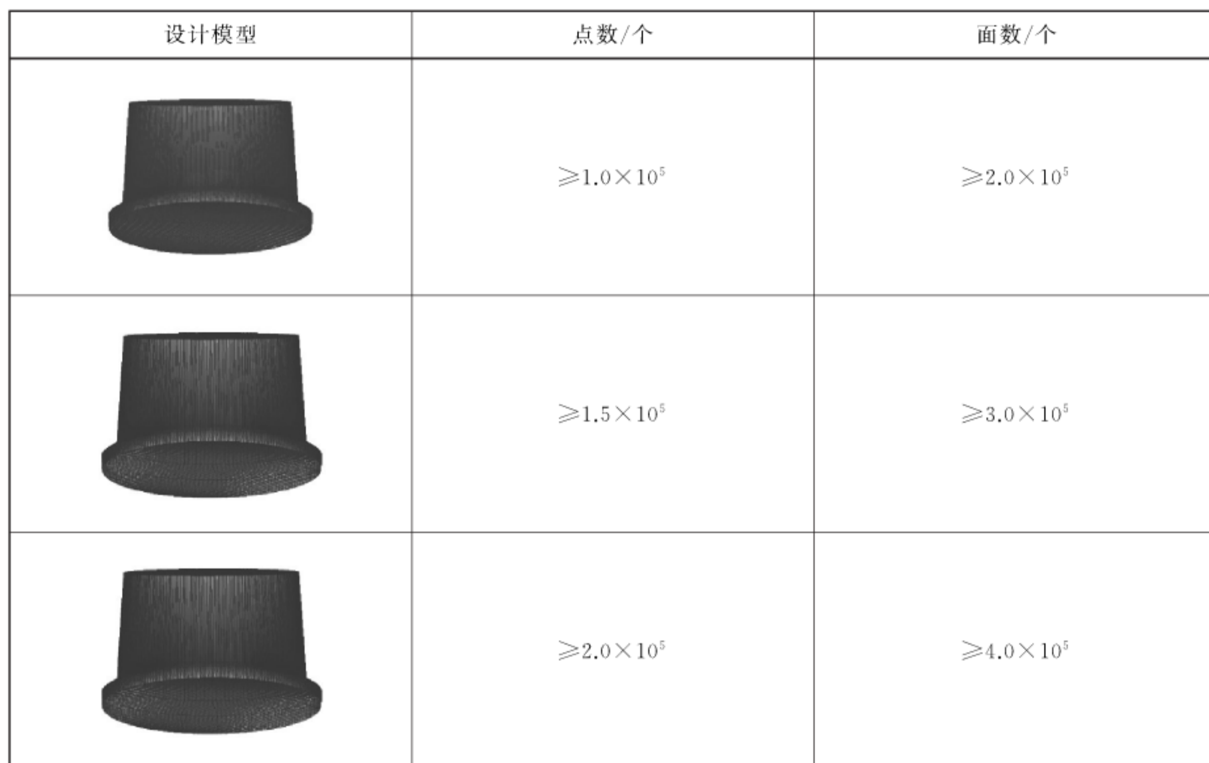
表 A.1 离散化标准预备体模型要求